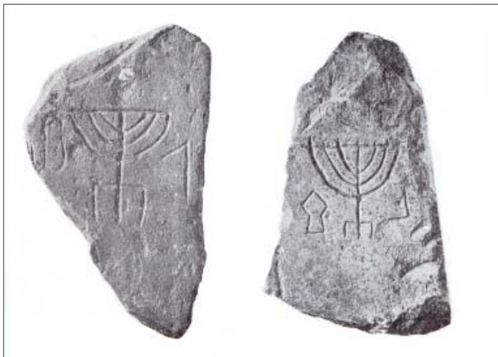
1–2. Zsidó szimbólumok a dunacsébi téglatöredékeken