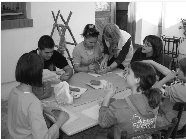
2010-es alkotótábor tagjai tanárnőjünkkel munka közben

1999-től részt veszek a Zentai Művésztelep grafikai műhelyének, valamint külföldi alkotótelepeknek a munkájában is. Grafikával fokozottabban 1989-től foglalkozom. Leggyakoribb kifejezőeszközöm a monotíпия, a montázsgrafika és a hidegtű. Ezenkívül ismertek még iparművészeti alkotásaim a kerámia és a nemez területén. Grafikáim első bemutatkozó kiállítása 1991-ben Újvidéken volt. Azóta 49 csoportos és 21 önálló kiállításon mutatták be grafikáimat, kerámia- és nemez alkotásaimat itthon és külföldön. 1991-ben, az első bemutatkozó kiállításom