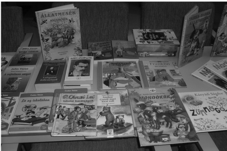
Új könyvek a könyvtárban

Befejezésül Makszim Gorkij gondolatát szeretném megosztani minden kedves olvasóval: „Szeressétek a könyvet, mert megkönnyíti az életet, baráti segítséget ad, hogy eligazodjatok a gondolatok, érzések és események sokszínű és viharos forgatagában. Megtanít tisztelni az embert és önmagunkat, szárnyat ad az elmének és a szívnek – a világ és az ember iránti szeretet szárnyait.”