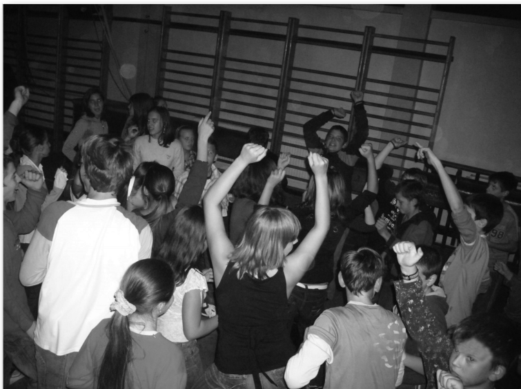
A gyermekheti rendezvénysorozat záróprogramja, a diákok által szervezett diszkó

A gyermekhét másik emlékezetes programja a főzőverseny volt, amit a lovas tanyán szerveztünk meg. A tanulók 12 bográcsban készítették a finomabbnál finomabb étkeket (osztályonként egy bogrács), amit végül a pártatlan zsűri