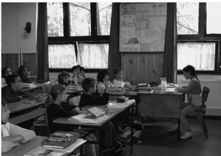
Ha én lennék a tanár... Tanár-diák csere a gyerekhétén

Kirándulás, játék a szabadban. Ez a nap a séta, a játék, a kirándulás napja. Elmegyünk a legközelebbi játszótérre, a helyi közösség udvarába, de a város központjában lévő játszótérre és a Népkerthbe is szívesen elsétálunk. Így mindannyian megtaláljuk a helyet, ahol kezdődhet az önfelédtt játék. Előtte és közben is elhangoznak a természet védelmével kapcsolatos szabályok, tudnivalók. Néhány csoport gyönyörködhet a Tiszánk szépségében. Hajóval lehajóztak a Halászcsárdáig. Ott vendégül látta őket egy anyuka és egy nagytata. Haza egy jót gyalogoltak.