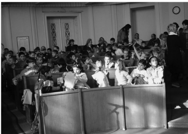
A diákszékhely képviselőinek fogadása a Városházán

Diákszékhely. Ez a mai elnevezése annak a csoportnak, akik képviselik iskolánk tanulóinak érdekeit. Tagjait a felsős tanulók alkotják. Régebben minden osztályközösség választott egy tagot, aki képviselte őket. Hagyomány volt a gyerekhét alkalmából, hogy a polgármester fogadta az iskolák képviselőit, akik meséltek az iskolájukról, élményeikről. Elmondhatták kívánságaikat, ígéretet is kaptak, hogy ami megvalósítható, azt a tenni vágyó és tudó felnőttek teljesítik. Ilyen kérelmek hangzottak el: az iskola jobb felszereltsége, pad helyett szék és asztal,