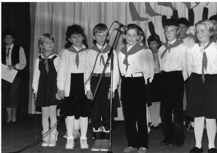
Pionírvatási ünnepség 1988-ban

Mielőtt bemutatnám iskolánk gyermekheti rendezvényeit, néhány sor erejéig visszatérek a múltba. Régen is ünnepeltük a gyerekeket, akkor is szervezethez tartoztak, ez volt az 1942. december 27-én, a Kommunista Párt vezetőségének ajánlatára megalakult Pionírszövetség. A köztársaság napján, november 29-én zajlott le a pionírvatás. Iskolánkban több éven keresztül október 8-án, a város