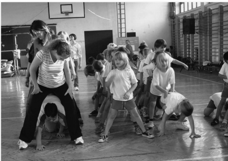
Önfelelt szülő-gyerek játék