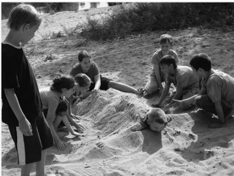
Játék a Tisza-parton

Felvétel a Gyermekszövetségbe. Ezen a napon veszik fel az elsősöket a szövetség soraiba. Ünnepléses műsorral kedveskednek nekik a pajtásaik. Verssel, énekkel, tánccal köszöntik őket. A zentai Gyermekbarátok Egyesülete ajándékkal lepi meg a szövetség újdonsült tagjait: táska a Gyermekszövetség emblémájával, a generáció fája, melyet az iskola parkjában ültetnek el. Ezután ők gondozzák. Velük együtt nő.