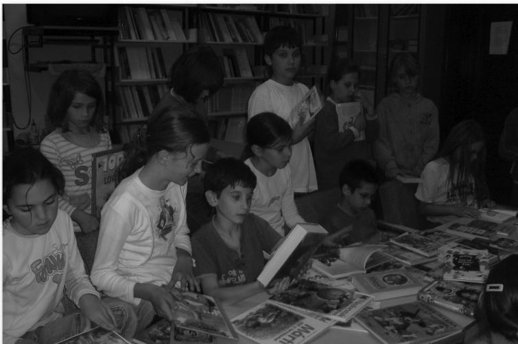
A gyerekek érdeklődése a könyvek iránt

A könyvtári tevékenység nem csupán könyvkölcsönzésből áll. Könyvtárismereti órákat is tartok, melynek keretében a diákok megtanulnak tájékozódni a könyvek birodalmában, elsajátítják a könyvtári viselkedés szabályait. Emellett ismereteket szereznek a könyv- és könyvtártörténetből, és jártasak lesznek a lexikonok használatában. A mesefoglalkozásokon megismerkednek a klasszikus és népmesék gyöngyszemeivel. Idén szakköri tevékenységgel is foglalkozunk. A tanórák közötti