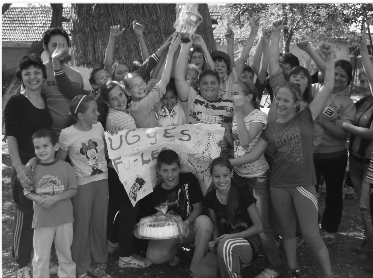
A 6. c osztály, a 2012-es főzőverseny bajnoka

Egész héten a diákok ügyeltek a tanárok helyett, és ők biztosították a zenét, ami minden szünetben szólt az iskolaudvaron.