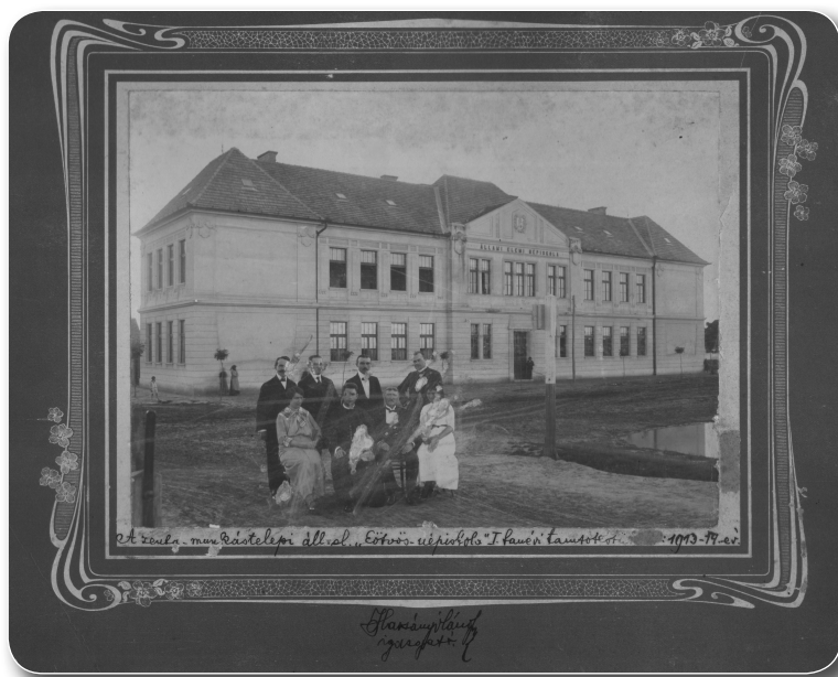
A Munkástelepi Eötvös-iskola és tanítói kara az 1913–1914-es tanévben

Még ebben a hónapban megnyílt az iskola könyvtára, s a földművelésügyi miniszter 85 könyvet küldött az iskolának. Április 1-jén a tanulókat a Royal moziba vitték ismeretterjesztő kép- és filmvetítésre, ahol bemutatták a 40 ezer mérföld vitorlával és gőzzel című ifjúsági tudományos előadást 100 színesben vetített eredeti negatív képpel és 12 mozgóképpel ( A Vezúv, Nápoly látképe, A