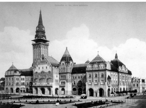
A Városháza épülete