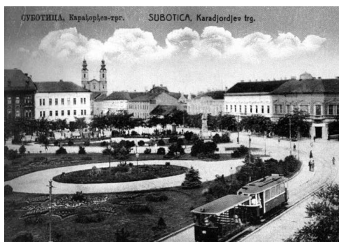
Fő utca és tér villamossal

Szabadka arculatához hozzátartozott a piros villamos, amely a Nagystrandtól – valamikori Férfistrand – az Eötvös – ma Strossmayer – utcán át a Bajai úti temetőig közlekedett 1897-től 1974-ig. Nyáron egy nyitott kocsi volt hozzácsatolva. Nagy élvezet volt nyitott kocsiban utazni. A fiatalok sokszor nótáztak. Néha még a harmonika hangja is hallatszott a nyitott kocsiból.