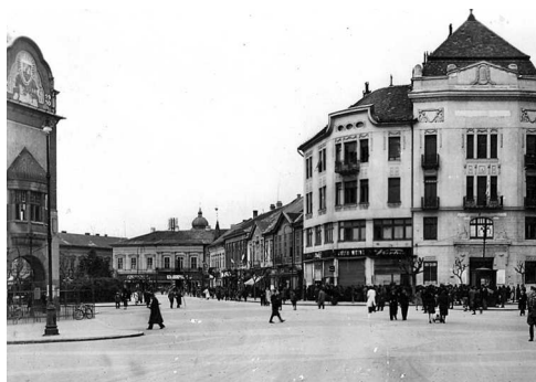
Magyar Állami Hitelbank épülete