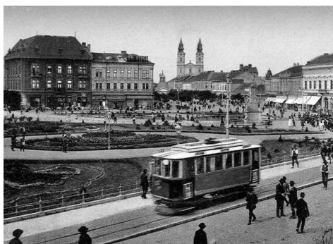
Szent István tér 1914 körül