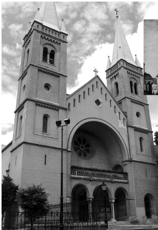
A ferences barátok temploma régen és ma