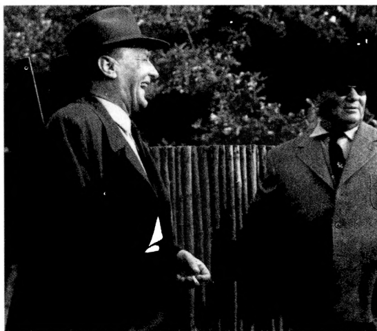
Kádár János és Tito

omlása után Erdély, Bánság, Bácska és Baranya magyar és német lakosságának egy része menekülve hagyta el szülőföldjét. 1944. október elején, amikor a szovjet haderő a szerbiai Bánság területére lépett, a délvidéki magyar közigazgatás evakuációja már egy hónapja tartott. A gyorsan visszavonuló magyar haderővel mintegy 14 ezer, 1941 folyamán áttelepült csángó és több