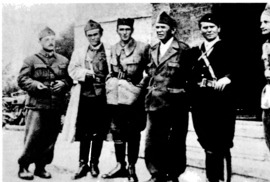
Tito partizánok között

A második világháború folyamán a tengelyhatalmak megszállása alatt álló területeken bontakoztak ki partizánok mozgalmak. Jelentős partizán-tevékenység volt Franciaországban, Olaszországban, Lengyelországban, a Baltikum országaiban, Ukrajnában, Jugoszláviában, Görögországban és Albániában. A második világháborút követően Észtországban, Lettországban, Litvániában, Kelet-Lengyelországban és Romániában folytattak a megszálló szovjetek ellen partizán-hadviselést.