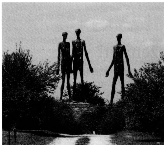
A Sajkás vidéki 1942-es szerb áldozatok emlékhelye a zsablyai Tiszaparton

foglalkoztató kisebbségügyi kérdésre, a magyar-csehszlovák kapcsolatokra kívánják helyezni. Kiváló példa erre Romsics Ignác 2003-ban kiadott összefoglaló műve, melyben a szerző hosszasan elemzi a magyar-csehszlovák viszony alakulását, míg a vajdasági eseményekről csak egy pár szó elegendő emlékezik meg: „Különösen nehéz volt ezt feltételezni a Romániából és Jugoszláviából spontán, Csehszlovákiából pedig szervezeten áttelepülők és új hazát, új otthon keresők tízezreinek a beszámolóit hallgatva. Az Erdélyből érkezők a Maniugárdisták 1944-1945-ös rémtetteiről (...), a délvidékiek a szerb partizánok vérengzéseiről, s a csehszlovákiaiak minden magyar nyelvű újság betiltásáról és iskola bezárásáról tudósítottak.” Szintén átsiklik az eseményeken a Pölöskei Ferenc, Gergely Jenő, Izsák Lajos által szerkesztett, és elsősorban egyetemi tankönyvként kiadott Magyar-