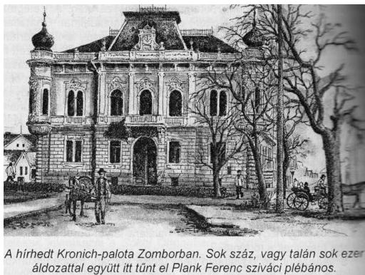
A hírhedt Kronich-palota Zomborban. Sok száz, vagy talán sok ezer áldozattal együtt itt tűnt el Plank Ferenc sziváci plébános.

A Kronich palota – Cirkl Rudolf festménye