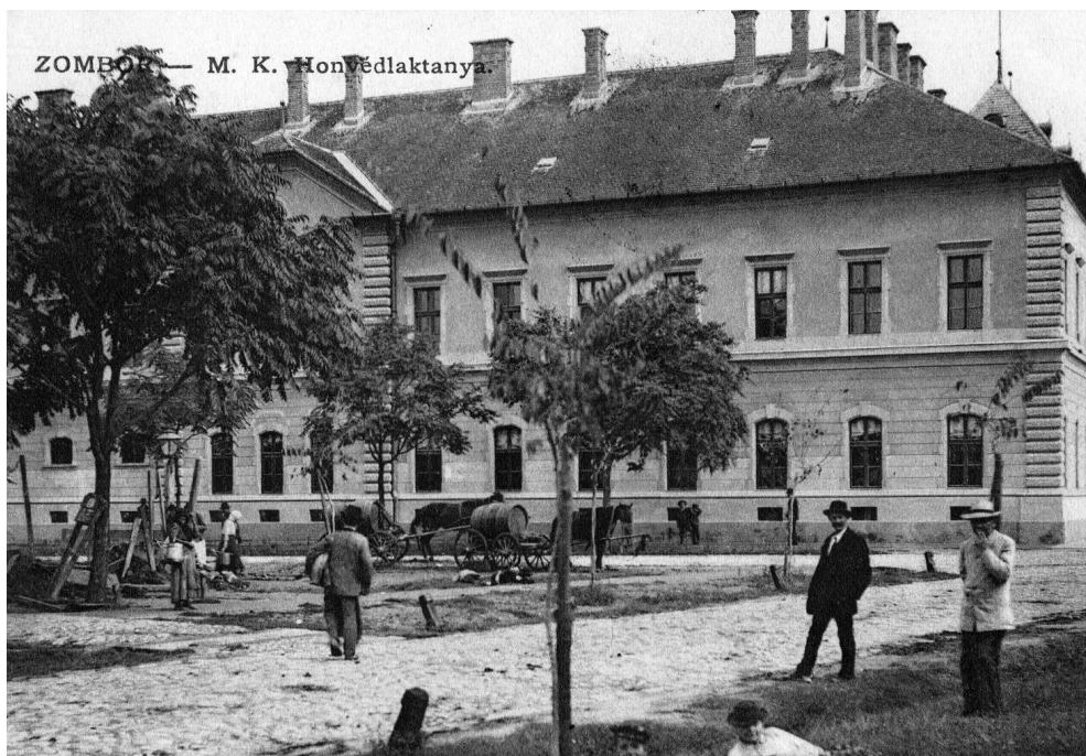
Zombor, 1920 előtt, Bezdani úti honvédlaktanya

„Zomborban, bár a magyar kémelhárítók Patarcsics szerb vezetőnél megtalálták a »fekete listát«, a kivégzésre szánt helyi magyarok névsorát, és a figyelmeztetett személyek nagy része elmenekült, mégis 5650 ártatlan magyart végeztek ki 10 ebben a városban (...). Az orosz és partizáncsapatok 1944. október 20-án vonultak be Zomborba, és azonnal megkezdték a megtorlást. Az áldozatok egyik gyűjtőhelye a Kronich-palota volt. Onnan vitték éjszakánként tehergépkocsikon az összekötözött foglyokat a lóversenyterre, ott lelőtték és tömegsírba földelték őket. Gyakran élve temették el az áldozatokat. Ezen a helyen 2500 magyart öltek meg. A gyalogsági laktanyában 11 mintegy 200 embert végeztek ki. A megkínzottakat gyakran izzó parázson futtatták mezítláb.(...)”