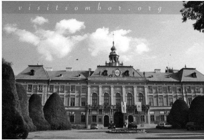
A zombori megyeháza napjainkban