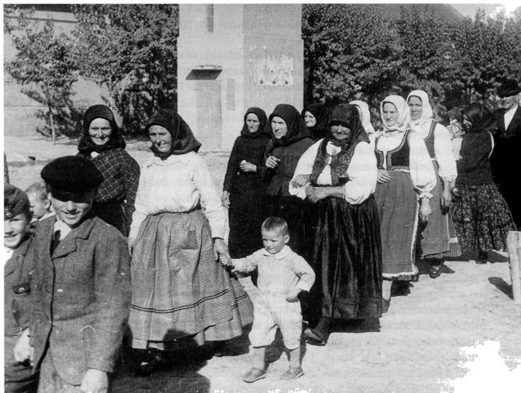
Bácskaiak és bukovinai székelyek Kishegyesen, 1941.

Az asszonyokat és a gyermekeket Szikicsre (Szeghegyre) szállították, ahol tavaszig dolgoztatták, majd 1945 márciusában bevaгонírozták és Bajára szállították őket.