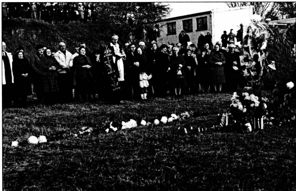
1992. november 2.

A megemlékezésnek visszhangja kelt a médiában, de nem volt elmarasztaló.