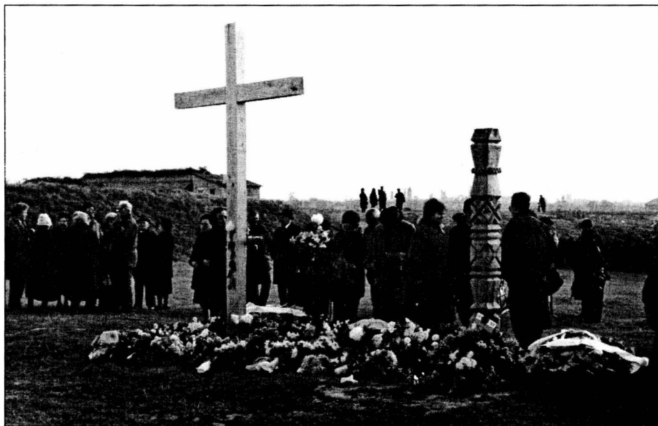
1993. november 2.

A sajtó és az elektronikus média is foglalkozott az eseménnyel; egyesek némi "kiigazítással" éltek. Az Újvidéki Rádió híre szerint a helyszínen alig voltak kétszázan.