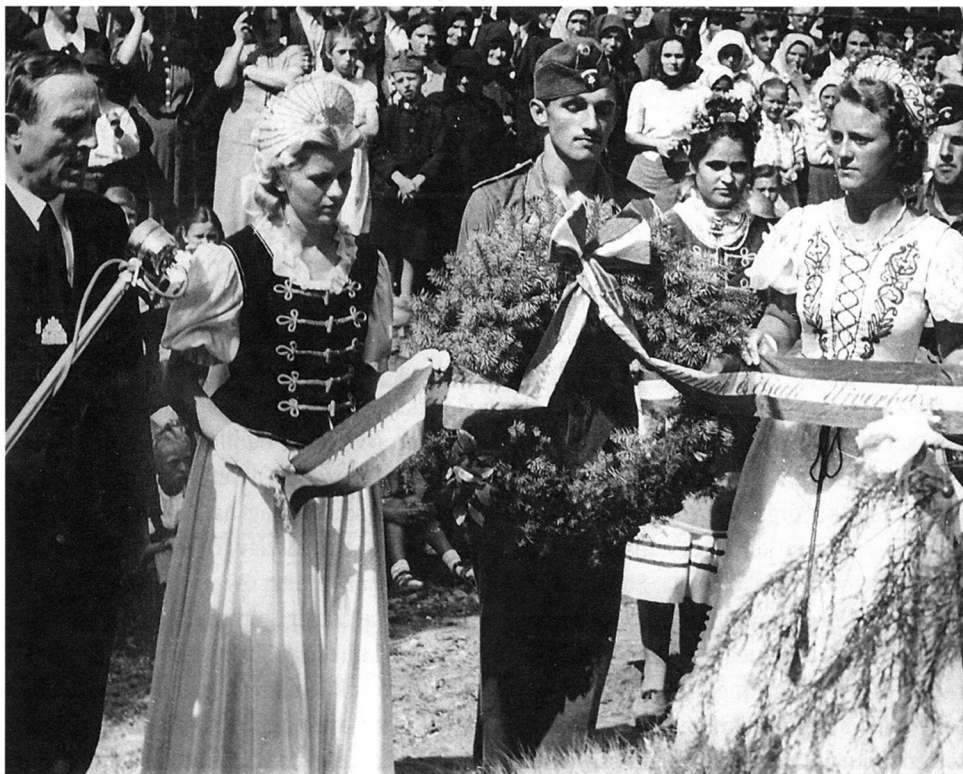
A bevonuló magyar hadsereg fogadása Délvidéken, 1941.

őhozzájuk tartozunk. Az az anyaország. Csak őhozzájuk köllene, hogy tartozzunk. Meg hát ők kellene, hogy legyenek védelmezőink. Én szerintem! Mert az volna (...) Nem kellene eldobni még ezt a kis maroknyi népet is, ami van, hogy most azok legyenek különbek, mint mink. Miért? Hát mink is magyarul beszélünk, meg katolikusok vagyunk. Meg minden, amilyen hit van – létezik az anyaországban, itt is van. Meg hűek. Hát nem lehet mondani, hogy a magyar nép rossz. Itt is – akár Délvidéken, akár Kárpátalján. De hát, ki tudja? Nem mén a fejembe sehogy se. Hogy miért – miért nem kellünk mink? Most, hogy úgy van-e nyilvánítva, hogy nem kellünk, vagy, hogy minek néznek bennünket, nem tudom. Saját fajtáját egy állam nem veszi a szárnya alá.