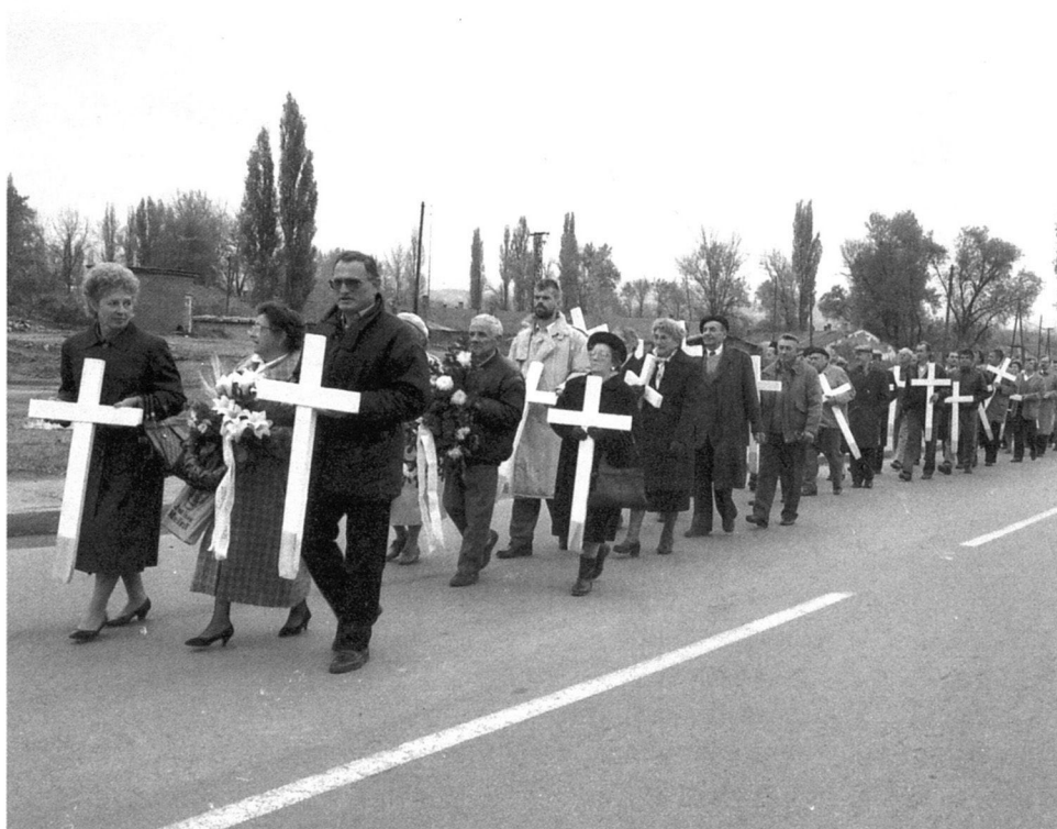
Újvidéki Száz kereszt, 1994.

Az új történelmi helyzet természetesen az anyakönyv lapjain is nyomon követhető. 1944. december 3-ától megváltozott a bejegyzés nyelve és írásmódja: a magyart a cirill betűs szerb váltotta fel. 1944. december 31-ig össze-