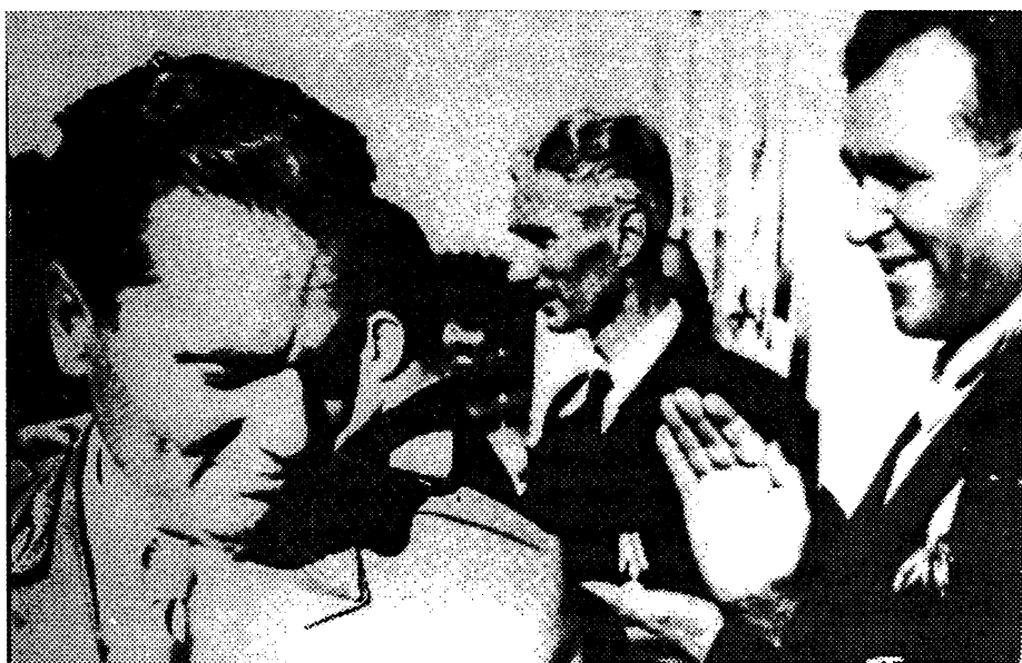
Tito első hivatalos látogatáson Újvidéken, 1945. május elsején. A tömegirtás már lezajlott, a koncepciók perok még hátra voltak.