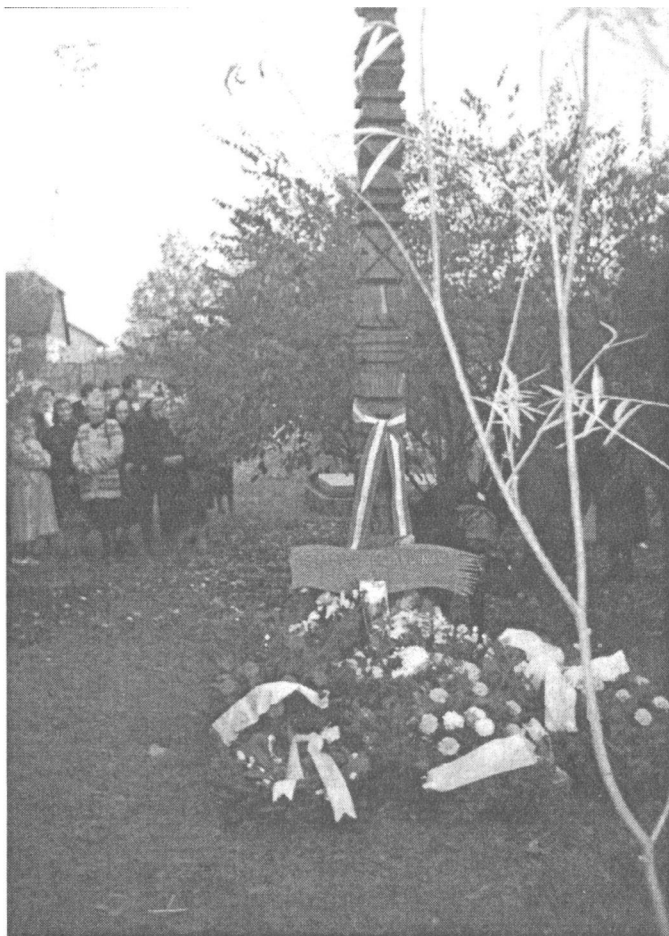
Becsei kopjafa az 1944/45-ös vértanúk emlékére