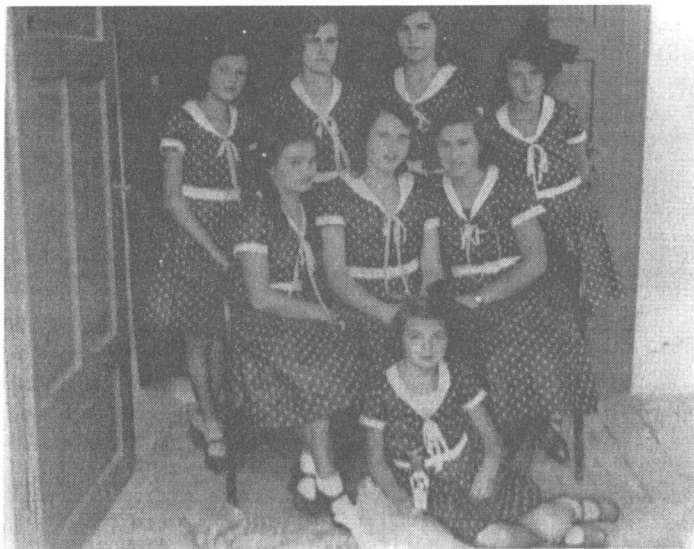
Magyarországi pöttyös lányok Bácsföldváron.

Eddig a borzalmas történet, amelyről sokáig iszonyodva meséltek az emberek a faluban, szerbek és magyarok egyaránt.