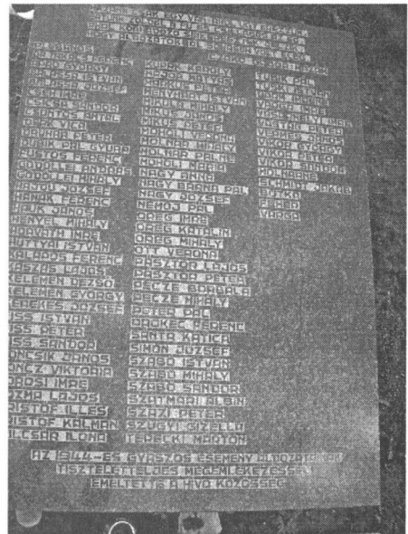
Péterrévén, az 1944-es magyar áldozatok emlékére állított kopjafa a márványtáblával.