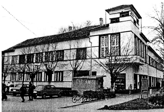
A községháza épülete. Udvarában szenvedett mártírhalt a falu nagylelkű lelkésze

mándlistul. Azt mondta, így fog maradni, hadd lássa mindenki. Mondtam neki: