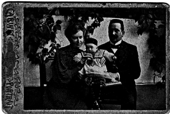
Az ifjú lelkész boldog családjával. Fiacskája 1-2 éves lehet. A felvétel 1909-1910 körül készülhetett