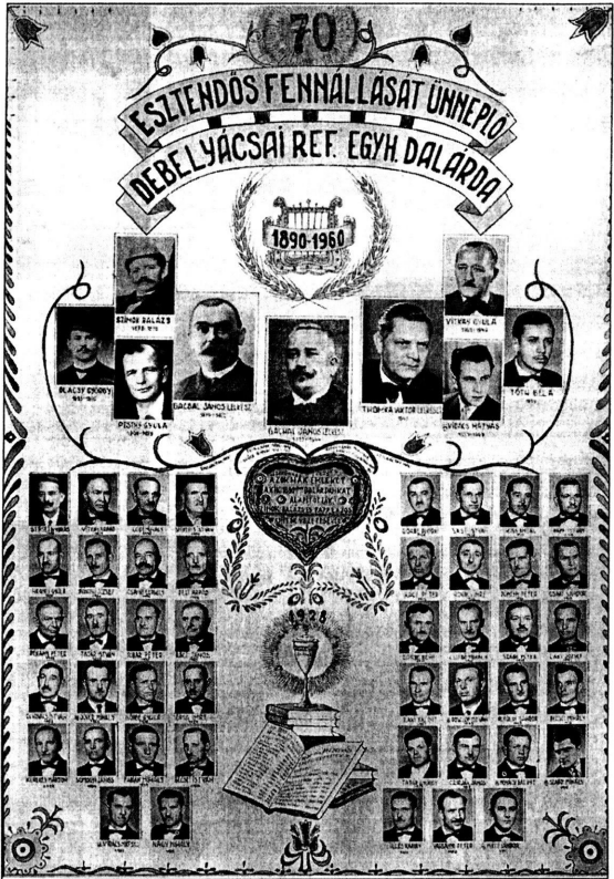
Gacsai, Gachal, Thomka, Vitkay... Mennyi kiváló ember fogott össze, hogy minél többen fejezhessék ki örömüket az éneken az Urat dicsérve