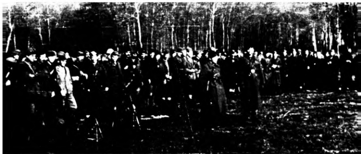
48. Brigádszemle Petenden