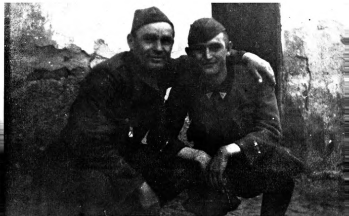
41. Apa és fiú találkozósa a háború vége felé Bjelovaron