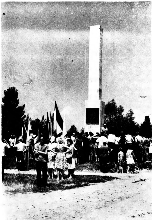
Bolmáni emlékmű (Koszorúzás, 1964. július 4.)