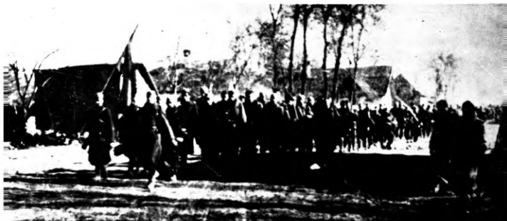
49. Bolmán felé menetel a Petőfi-brigád