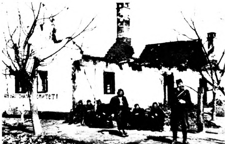
46. A barcosok csoportja a lerombolt Bolmánban