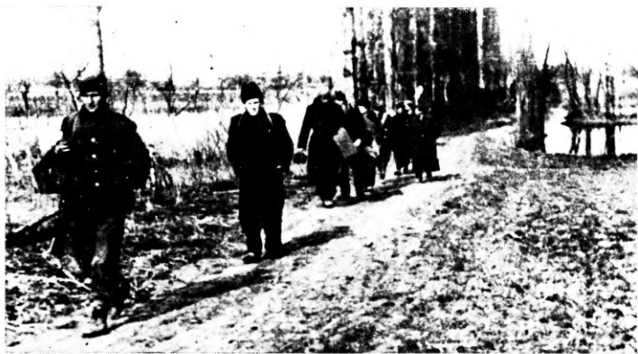
47. A Petőfi-brigád előrse Bolmán térségében