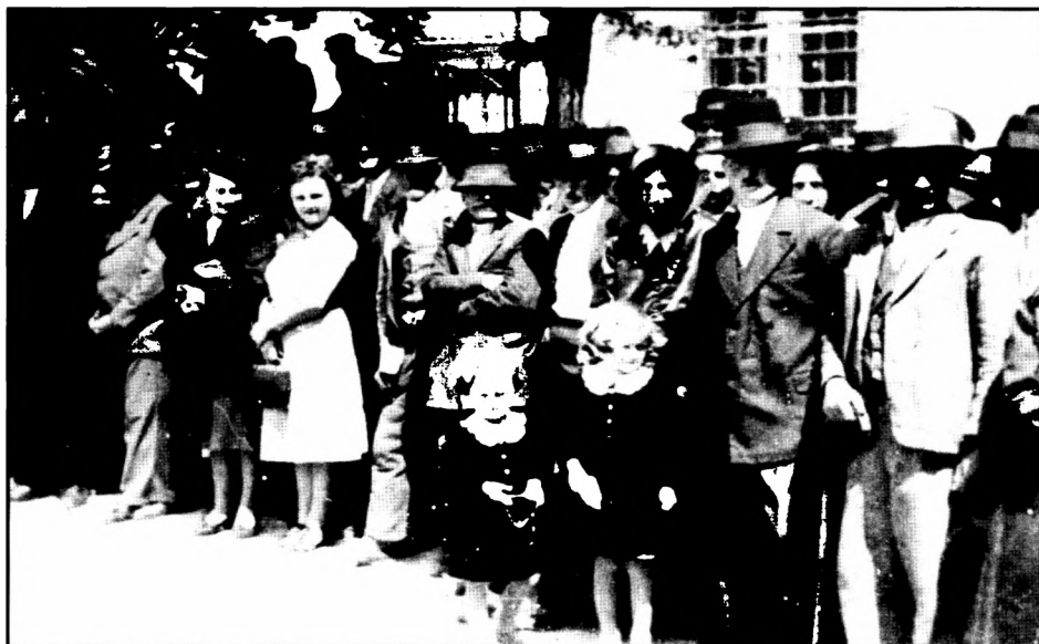
A magyarokat váró tömeg 1941 virágvasárnapján