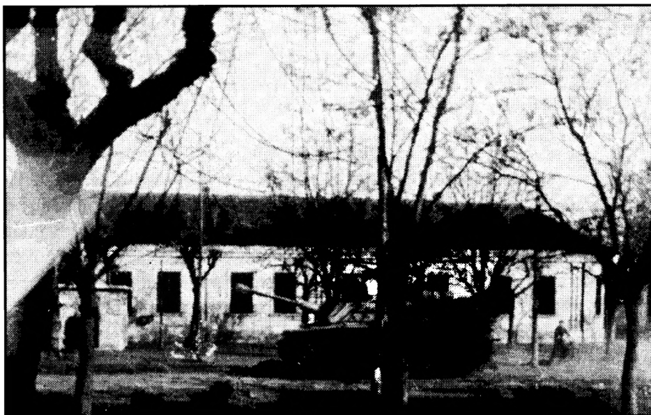
Azonosítatlan felségjelű tank a községháza előtt