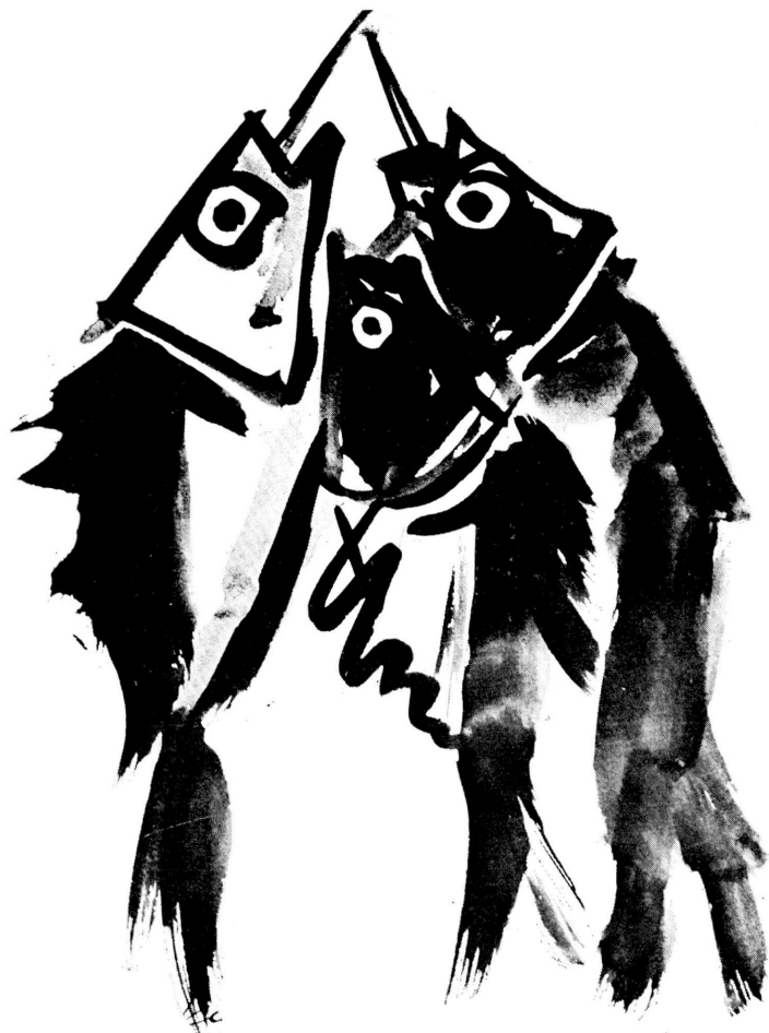
I A L A K , 1958