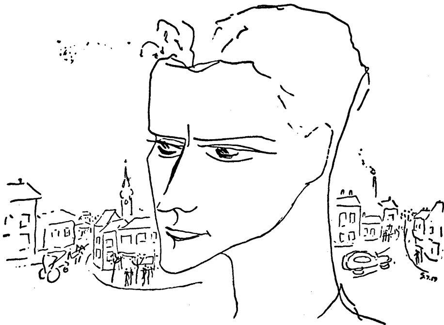
Sáfrány Imre illusztrációja