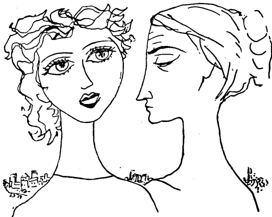
Sáfrány Imre illusztrációja

Már éppen a könyvek mögé akarta lökni a képet — mit is keres egy kép a heverőn, a könyvek mögé, az apja könyvtárából való Brehmek, Freud pszichoanalízise ugyanonnan, aztán két-három előkelő külsejű, fekete bőrkötésű orvosi könyv, a zágrebi enciklopédia első kötetei, az akvizitőr szemtelenül csökönyös volt, de végülis egész jól mutatnak, nem baj, hogy megvette, azután a kötelező Gorkij a Kultura kiadásában — amikor a keze hirtelen megállt a levegőben. Kedves kis srác. Megpróbált ráismerni magára a képen. De nem ismert rá, arra sem emlékezett, mikor