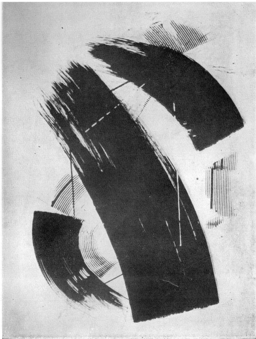
A C S J Ó Z S E F mehanika