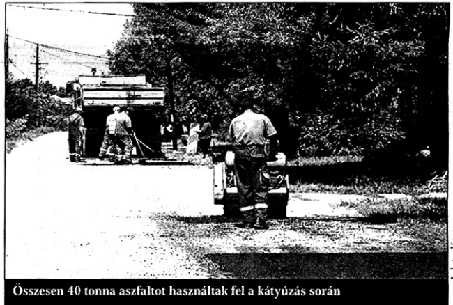
Összesen 40 tonna aszfaltot használtak fel a kátyúzás során