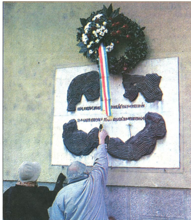
Koszorú került az emléktáblára Topolya központjában

kivégeztek. A könyv a bolmani hadszíntérről is szól, ahol nagyon sokan áldoztak, ahol estek a jobban felszerelt, visszavonuló német csapatokkal vívott csatában. A Petőfi-brigádnak rövid élete alatt sok