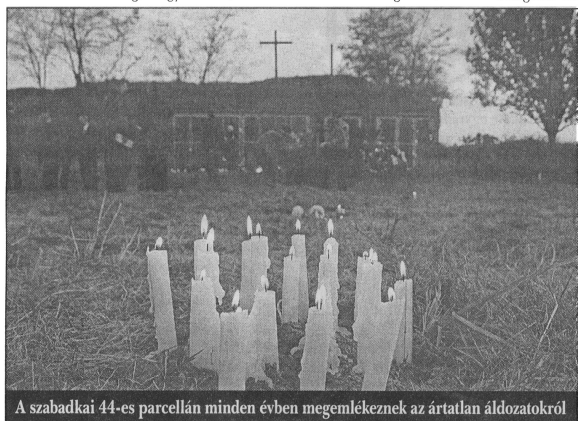
A szabadkai 44-es parcellán minden évben megemlékeznek az ártatlan áldozatokról

Megvan az összes adat az OZNA és a KNOJ tevékenységéről, így most rajtunk a sor, hogy kiválasszuk azokat a szakértőket, akik ezeket az adatokat feldolgozzák