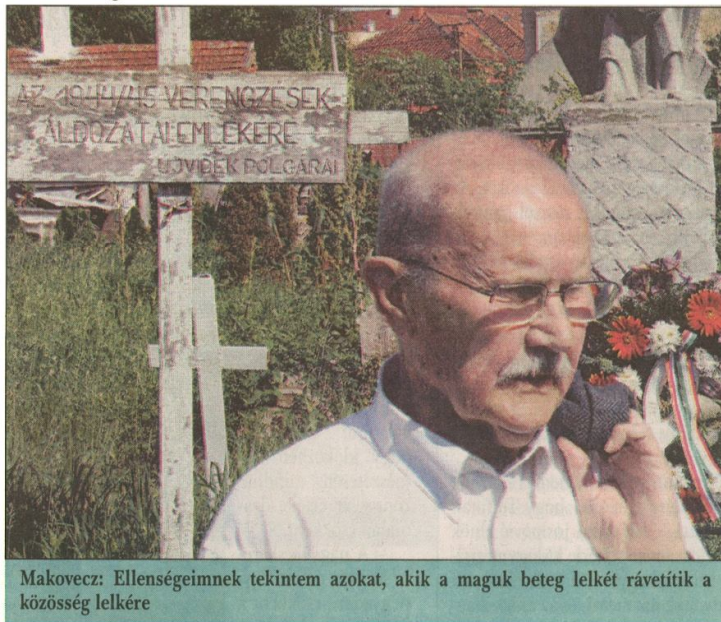
Makovecz: Ellenségeimnek tekintem azokat, akik a maguk beteg lelkét rávetítik a közösség lelkére