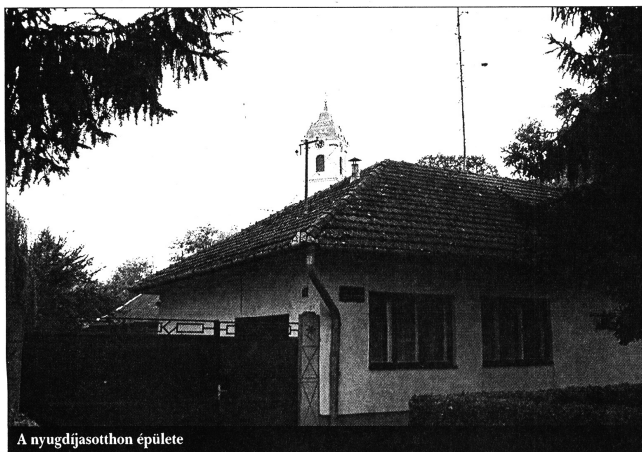
A nyugdíjasotthon épülete

– Szép emlékü elődömet, Kiss Antal esperes urat kell mindenekelőtt megemlítenem, aki, azt kell mondanom, minden papírost egészen 1945-ig visszamenőleg nagyon hűségesen őrzött, és maradéktalanul átadta, ami-