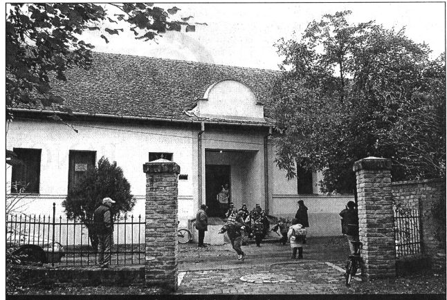
A mai óvoda épülete egykor a református iskola épülete volt

– Erről október 21-én volt tárgyalásunk, és a Földművelési Minisztérium képviselője is jelen volt, aki ellenezte a javaslatunkat, de a fölhozott érveink alapján megegyeztünk. A komaszáció tekintetében szerencsés helyzetben vagyunk, mert úgy állnak a földek, hogy