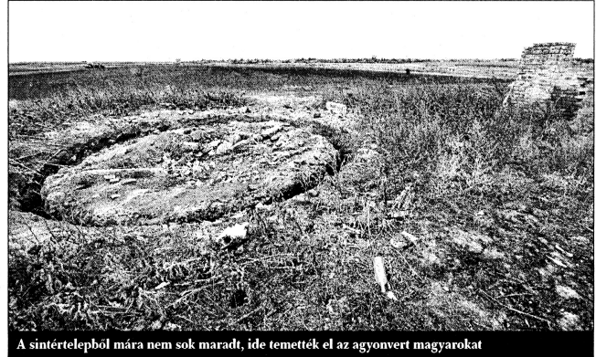
A sintertelepből mára nem sok maradt, ide temették el az agyonvert magyarokat