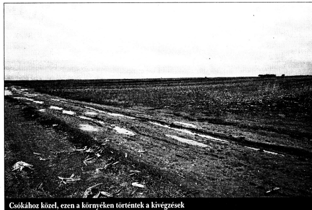
Csókához közel, ezen a környéken történtek a kivégzések

– Azt a földet már eladtuk, nem tudom, most ki a gazdája. Mindössze egy gazos kisebb halom jele-