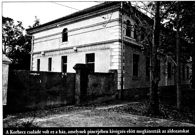
A Korhecz családé volt ez a ház, amelynek pincéjében kivégzés előtt megkínzották az áldozatokat

megjelenni, halottak napján egy-egy virágcsokor jelzi, hogy van, aki mégsem feledkezett meg róluk.