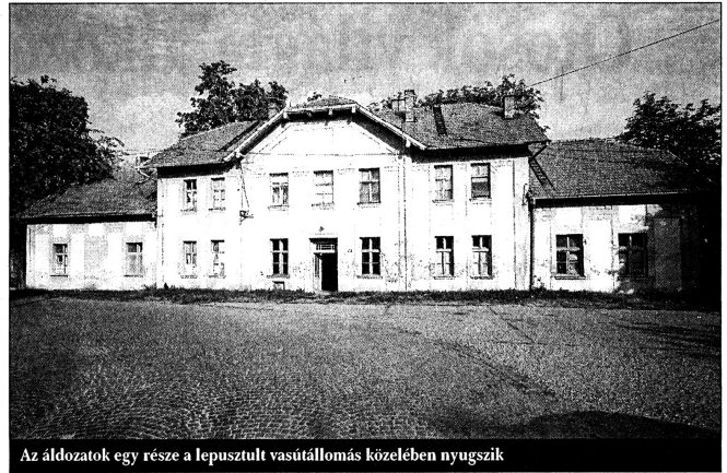
Az áldozatok egy része a lepusztult vasútállomás közelében nyugszik

Az ágyon a mennyeztető fölkrakták a dunnát, párnát, mögötte volt a hátsó szoba ajtaja, és ott bent volt édesapám. Én akkor három-négy éves kisgyerek voltam, tudtam arról, hogy ott rejteget-