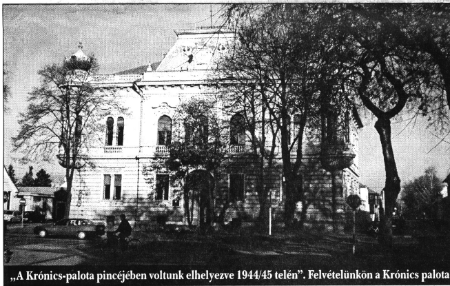
„A Krónics-palota pincéjében voltunk elhelyezve 1944/45 telén”. Felvételünkön a Krónics palota

Németországból, miután már idős korában megtudta, hogy errefelé nem a kommunizmus van hatalmon, és nem a partizánok az urak. Tele reménnyel végre haza mert jönni. Hazajött, és mesélt azokról a szörnyű napokról, hetekről, amit a Krónics-palotában, Zomborban éltek át a foglyok.