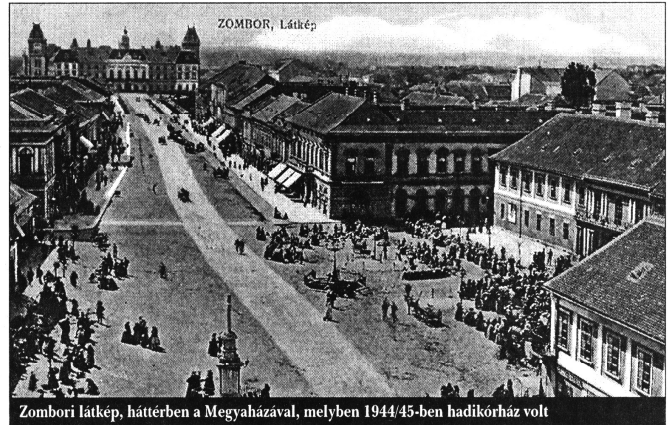
Zombori látkép, háttérben a Megyaházával, melyben 1944/45-ben hadikórház volt

„A Krónics-palota pincéjében voltunk elhelyezve 1944/45 telén. Össze kellett tapadnunk, hogy