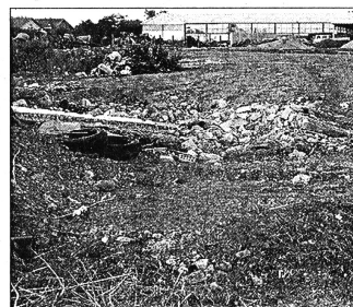
A valamikori német temető – a járványveszélyre hivatkozva – eltárolással, ma sivatár telek, egy üzem és szemétdomb található a területén

A szikisi (Lovčena) táborba kerültek azok a székelyek is, akik nem menekültek el. A jareki táborban tehát leginkább idősök, gyermekes anyák, beteges férfiak lettek haláluk. A tábor megsemmisítő voltól egyöntetűen a vélemények, még a szerb történészek közül is sokan elismerik ezt a tényt. A háború végétől a németiség egészét néppellenségnek tekintették, a náci által megalapozott kollektív bűnösség eszméjét burkolták kommunista mezbe. A jareki német őslakosság evangélikus vallású elődei a XVIII. század végén zömmel a Rajna vidékéről telepítették a faluba, legtöbben – mintegy kétezen