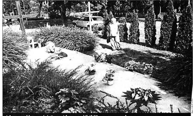
A legnagyobb temerini tömegsírból nagyjából 80-an nyugszanak