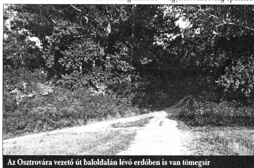
Az Osztrovára vezető út baloldalán lévő erdőben is van tömegsír

Moholon a helybeli adatközlők szerint a kivégzések 1944. október 8-tól egészen 1945 elejéig zajlottak. Az áldozatok száma több százra tehető, hogy pontosan mennyi, az talán soha nem fog kiderülni. Jórészt férfiakat végeztek ki, de akadtak az áldozatok között nők is. A kivégzettek kezeit dróttal összekötözték, egy részét a Tiszába lőttek