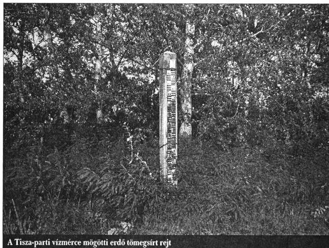
A Tisza-parti vízmérce mögötti erdő tömegsírát rejti