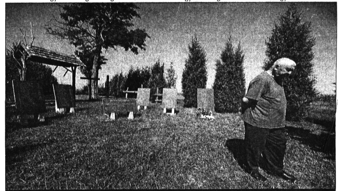
A márványtáblakra kerültek a nevek

– Ahol a lakosság egy emberként kiállt azokért, akiket megvádoltak, ott nem történt kivégzés. Sajnos Bajmokon senki sem merete azt mondani, hogy az elfogottak ártatlanok, így mondvaszínált