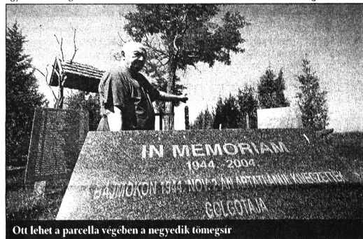
Ott lehet a parcella végében a negyedik tömegsír

Volt egy olyan eset is, hogy az illetőt szabadon engedték, de mivel bent felejtette a kabátját, visszament érte, és többé nem engedték el