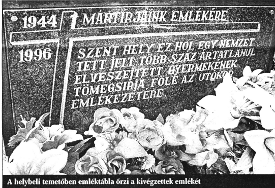
A helybeli temetőben emléktábla őrzi a kivégezettek emlékét