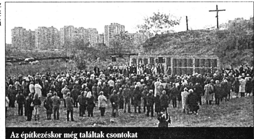
Az építkezéskor még találtak csontokat

család is, amelyik nehezményezte, hogy hozzátartozója az áldozatok listáján szerepel – meséli dr. Bogner. Aki részt vettek a bizottság munkájában, azoknak rosszindulattal, fenyegetésekkel is szembesülniük kellett. Az 50 éves évfordulóra szervezett megemlékezésen álarcos emberek figyelték őket a távolról, sőt a rendőrség is jelenlétére, hogyha atrocitások történtek, azért a megemlékezést szervezők lesznek a felelősök.