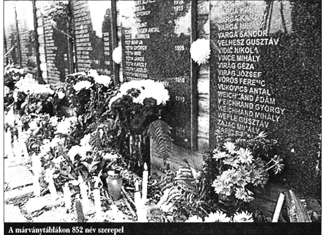
A márványtáblákon 852 név szerepel