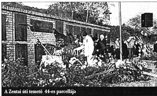
A Zentai úti temető 44-es parcellája

– 1994-et írtunk. Dúlt a boszniai háború, nagy volt a nyugtalanság. Meglepett, hogy engem kerestek meg, persze akkor még nem tudtam, hogy a községi építészek egyike sem vállalta a megbízást, de gondolkodás nélkül elvállaltam, hiszen 1944-ben