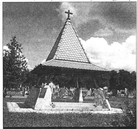
Horgoson kripta várja az áldozatok földi maradványait

A martonosiak mind holtját nyilvánították a kivégzett hozzátartozóikat, pedig nem volt egyszerű, mert meg voltak hamisítva a halotti anyakönyvi kivanatok, mindegyiken más dátum szerepelt. A rehabilitáció mégis elakadt, mert ha elismerik a tényeket, akkor bezonyosodik, hogy itt népi-