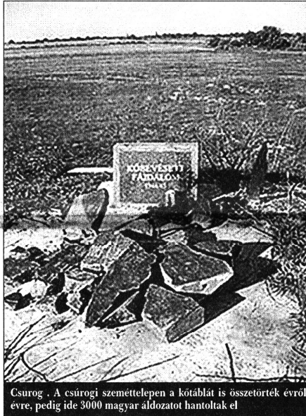
Csurog. A csurogi szeméttelen a kótáblát is összetörték évről évre, pedig ide 3000 magyar áldozatot hantoltak el

Ha ön is benne volt a kutatócsoportban, hogyan kerülhetett sor ezekre az eltérésekre?