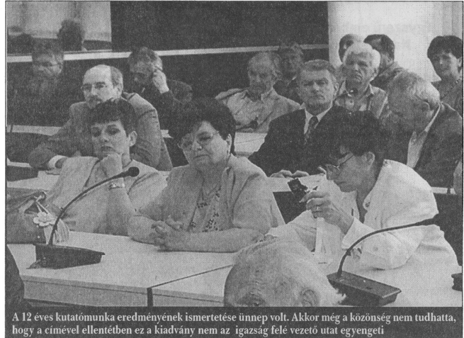
A 12 éves kutatómunka eredményének ismertetése ünnep volt. Akkor még a közönség nem tudhatta, hogy a címével ellentétben ez a kiadvány nem az igazság felé vezető utat egyengeti

Őn szerint miért viszonyultak a kutatók ilyen felelőtlenül ehhez a kérdéshez?