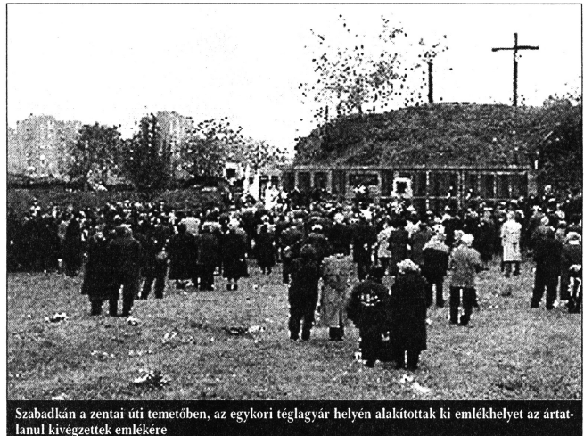
Szabadkán a zentai úti temetőben, az egykori téglagyár helyén alakították ki emlékhelyet az ártatlanul kivégeztettek emlékére