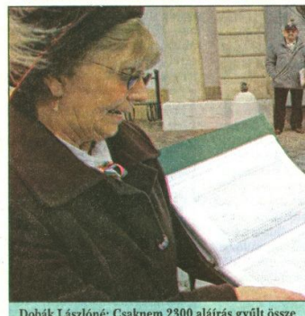
Dobák Lászlóné: Csaknem 2300 aláírás gyűlt össze