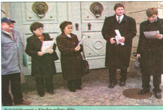
Sajtótájékoztató a Sándor-palota előtt