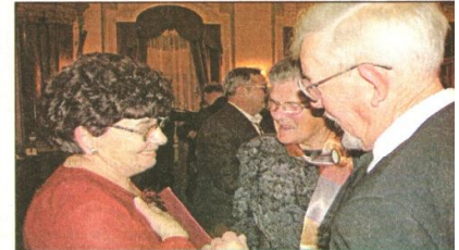
Az első vajdasági gratuláció Budapesten