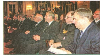
Díjazottak és vendégek