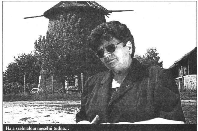
Ha a szélmalom mesélni tudna...

Ilyen körülmények között kellett kiállnom a saját és a nemzeti közösségünk, valamint az emberi jogok megvédelméért, amikor a belső zsebben ott volt a pisztoly, a csizmaszárban pedig a kés. Sok fenyegetést kaptam telefonon keresztül is, sőt a házunkat fel akarták robbantani. Soha nem szégyelltem magyarul felszólalni a parlamentben. Törvény adta jogom volt, hogy magyarul szóljak, és büszkén életem vele. Bár volt