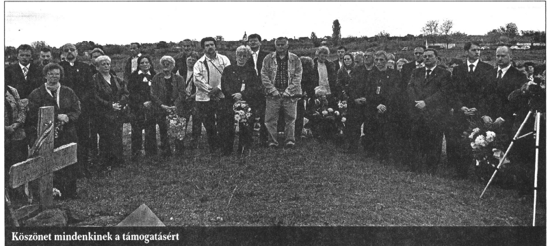
Köszönet mindenkinek a támogatásért

■ Édesanyja mit mondott édesapjáról? Mi-