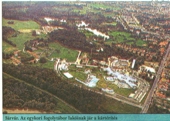
Sárvár. Az egykori foglyotábor lakóinak jár a kártérítés

ról azonban nem adtak ki bizonylatot annak idején. A másik észrevételünk az eljárás illetékességére vonatkozik. A magyarországi törvényben az áll, hogy ha valaki elégedetlen a Központi Igazságügyi Hivatal döntésével, akkor ezt megfellebbezheti a Budapesti felsőbb bíróságon. Ezt az eljárást már nem finanszírozzuk, így az érintettek igen magas költségei lesznek, ha erre a lépésre szánja magát. Magyarország és Jugoszlávia 1968-ban aláírt egy ma is érvényben levő jogsegélynyújtási szerződést,