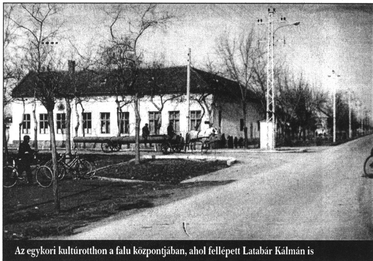
Az egykori kultúrotthon a falu központjában, ahol fellépett Latabár Kálmán is

Baranyi István megjegyezte, a helytörténeti kutatásokat nem tudja és nem is akarja befejezni, habár 2000-ben szívműtéten esett át. Mohol történetéből sok minden nincs feltárva, még a zentai levéltárban is sok a feltáratlan anyag. Jelenleg is anyagot gyűjt a faluról, és ezúton is felkéri polgártársait, akik megőrizték ősiek emléktárgyait, végrendeleteket és egyéb okiratokat, régi fényképe-