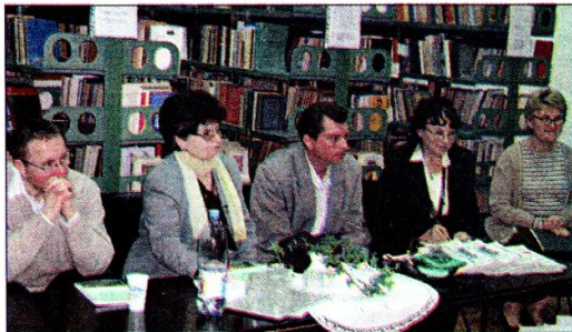
Az est vendégei

máig viszonylag egyoldalúan bemutatott előzményeiről és borzalmas következményeiről: a bosszúról, a megtorlásról, amely Vajdaságban leginkább a németeket és a