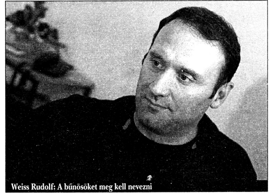
Weiss Rudolf: A bűnösöket meg kell nevezni