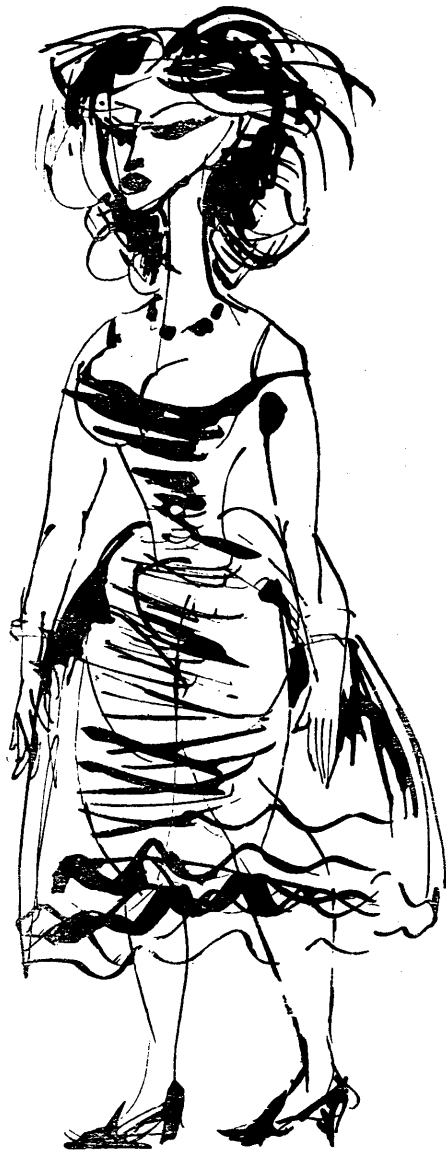
Sáfrány Imre szüvegrajza

De az nem szólt semmit. Közömbösen nézett maga elé. Nem árulta el, hogy kezdettől fogva érezte az alelnök maga-