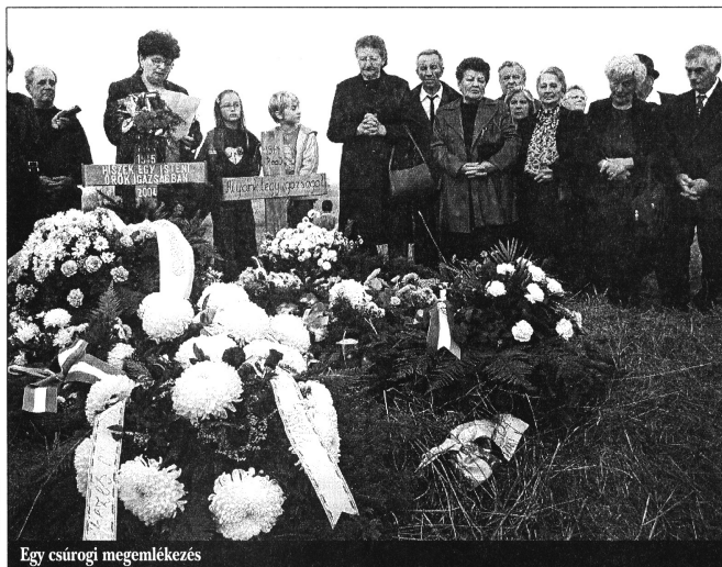
Egy csutorai megemlékezés

napig is ödzködik attól, hogy szembenézzen a tényekkel. A tényfeltáró bizottságnak tizenhárom tagja volt, mindegyik parlamenti párt képviseltette magát, és engem neveztek ki elnöknek. A tényfeltárás projektumát is magam készítettem el. Kiváló csapat állt össze. Hatalmas munkát végeztünk, és amikor 2004-ben letelt a bizottság megbízatása,