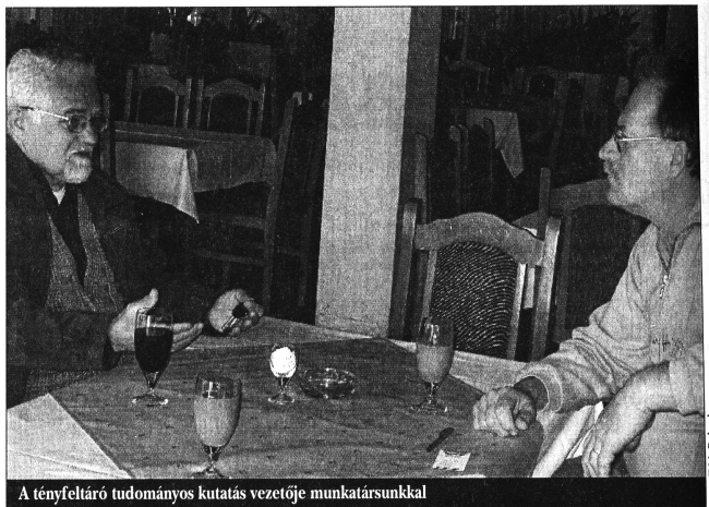
A tényfeltáró tudományos kutatás vezetője munkatársunkkal

– Miután megalakult a bizottság, a szakmabeliek többségétől elmarasztaló bírálatot kaptam. Az ember ilyenkor elgondolkodik, hogy mit tegyen. Mindig is az igazság híve voltam, és ebben az esetben is csak ez vezérelt, az, hogy tudáshoz és erőmhez mérten felfedjem az igazságot, ezért nem törődtem a bírálatokkal, fenyegetésekkel. Tudtam, hogy olyan munkába kezdünk, amellyel mindaddig tudományos szinten nem foglalkoztak, sokáig beszélni sem lehetett erről, és még ma is nagyon sok embernek kellemetlen szólni róla. Mellesleg a szerbekre sajnos inkább az jellemző, hogy hazugságokra építik a társadalmat, ezért maga a tudomány is évtizedeken át ödzködött, és még a mai