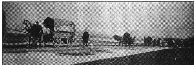
GYÁSZOS TÁVOZÁS 1944-BEN

Itthon pedig az egykori német temetők sorsa intézményesen még mindig rendezetlen. Sokfelé ez nagyon is meglátszik. Itt-ott akad már emlékmű az egykor itt éltek, illetve haltak emlékére, de a gyűjtőtáborok helye zömmel jelöletlen. Mellesleg akárcsak az 1944–45-ös magyar áldozatok kivégzésének, illetve elföldelésének színhelyei.