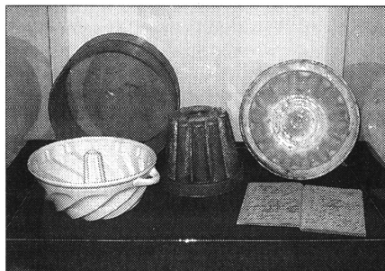
NÉPSZERŰ VOLT A KUGLÓF, SÜTŐFORMÁI MÁIG MEGMARADTAK

Hát igen, egyszer mindennek eljön a maga ideje.