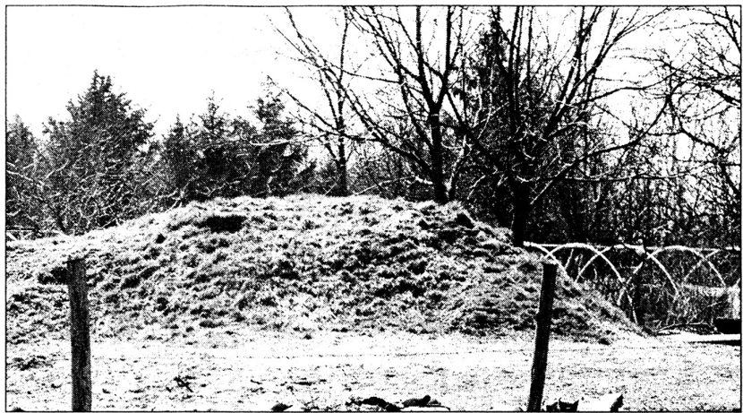
Lótemető a Körte utca végén