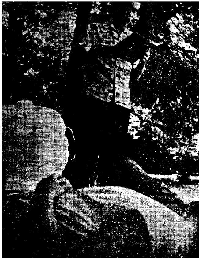
Deák Ferenc elbeszélését olvassa a kañenicei parkban

és azt hiszi, hogy ezzel hasznára van az irodalomnak. Végeredményben mindenkinek van többé-kevésbé egyéni véleménye, de ez még nem avatja kritikussá. Ezért talán jól tennénk, ha az ilyen vitára okot adó véleményünket előbb szűkebb körben ismertetnénk, ahol társainktól rögtön hallhatnánk ellenvéleményt is, (mint például ezen a mai találkozón). Ne akarjunk tisztázatlan és egyéni véleményünkkel mindjárt a nyilvánosság elé lépni.