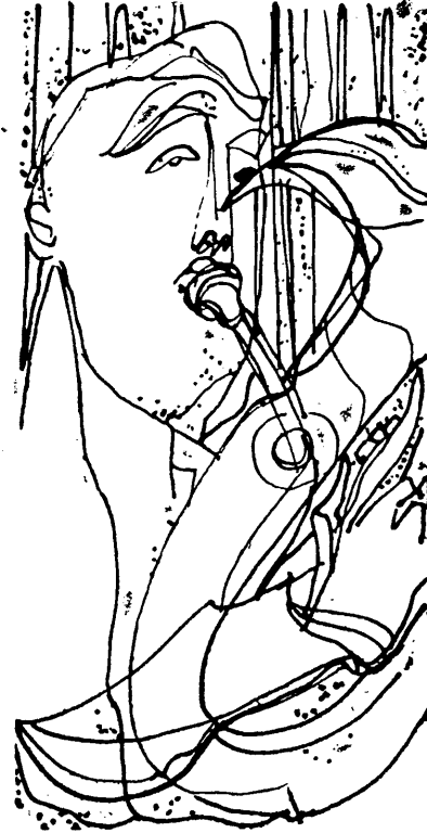
B. Szabó György szövegrajza