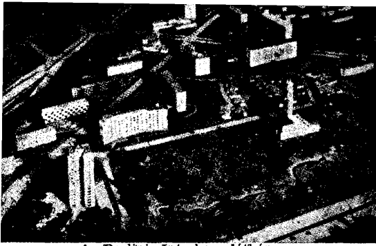
A Berlínt Interbau lát képe